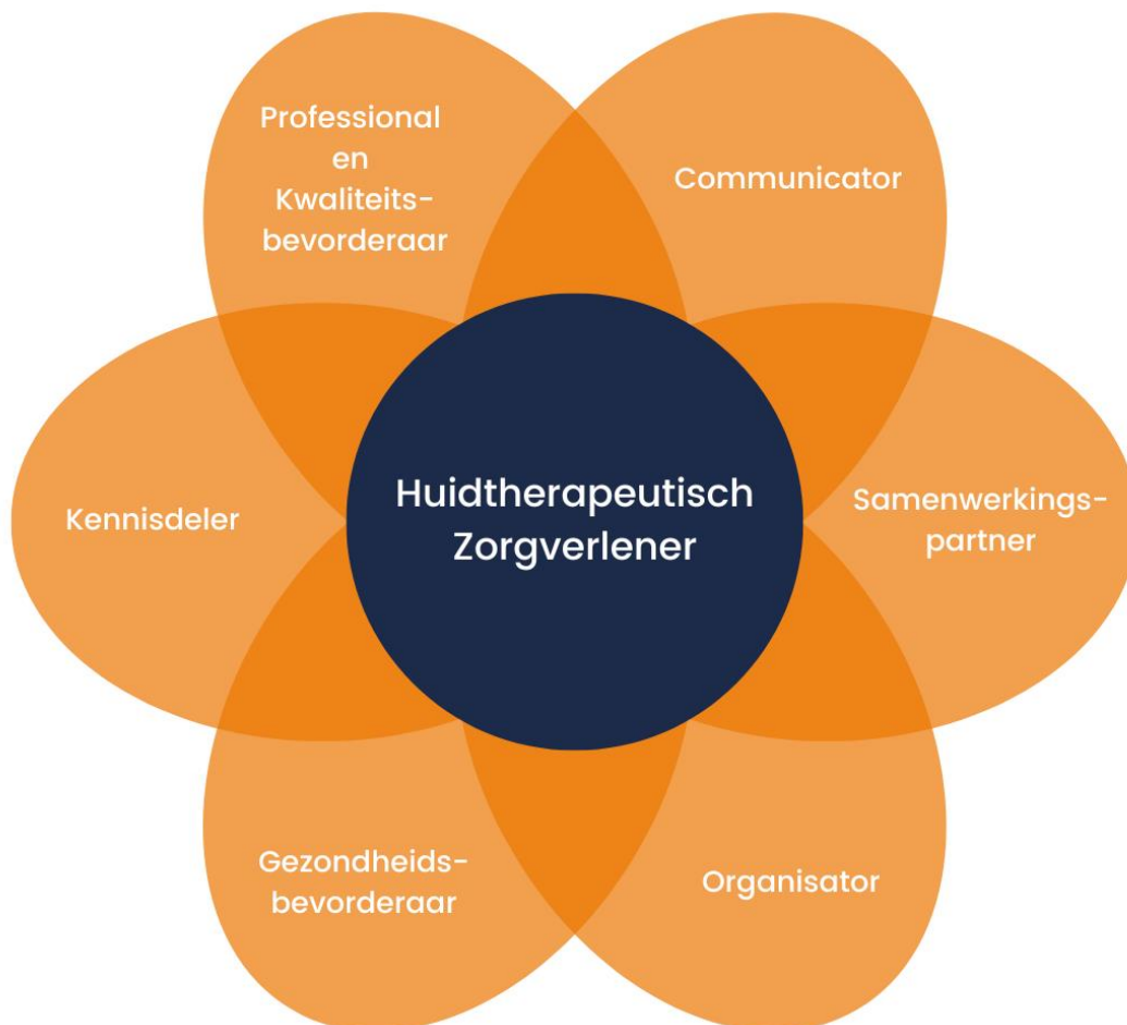
Figuur 3 CanMEDS Huidtherapeut

Net als bij andere (para)medische beroepen beschrijven we het competentieprofiel van de huidtherapeut aan de hand van zeven competentiegebieden, die zijn gekoppeld aan rollen. Rondom de centrale rol van paramedisch zorgverlener bevinden zich zes aanpalende beroepsrollen. Dit zogenaamde CanMEDS-model is in figuur 3 weergegeven. We beschrijven deze verschillende beroepsrollen en de daarbij behorende competenties relatie tot passende huidzorg.